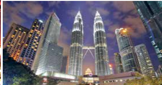
PETRONAS Twin Towers, Kuala Lumpur