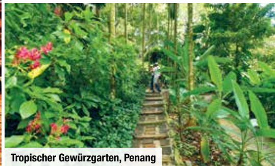
Tropischer Gewürzgarten, Penang

Ihrem Hotel mit einem Steamboat-Dinner verwöhnt, einer Spezialität dieser Region.