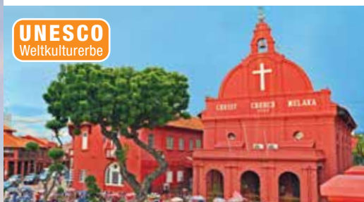
Christ Church auf dem „Roten Platz“, Malakka