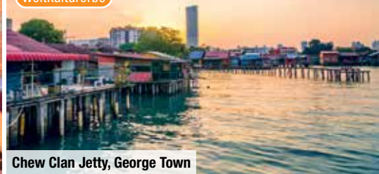
Chew Clan Jetty, George Town